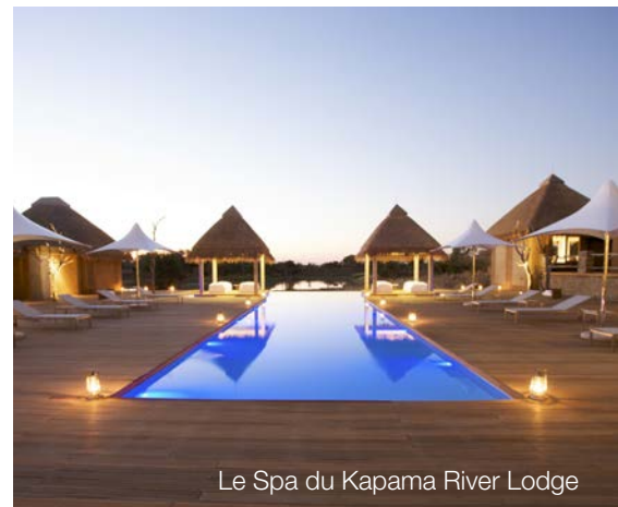
Le Spa du Kapama River Lodge

Climat méditerranéen et situation idyllique entre terre et mer, nous vous la conseillons vivement pour profiter de sa beauté naturelle, de son histoire fascinante, de sa culture, de sa gastronomie, de ses vins primés et pour son style de vie décontracté. Que vous soyez un visiteur actif ou que vous cherchiez simplement à vous ressourcer, le Cap saura vous satisfaire. Les activités, visites au et autour du Cap sont multiples et variées, recommandations et organisation sur simple demande.