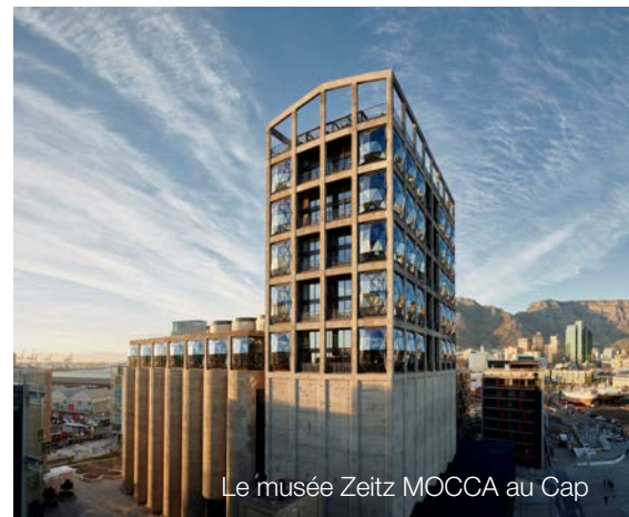
Le musée Zeitz MOCCA au Cap